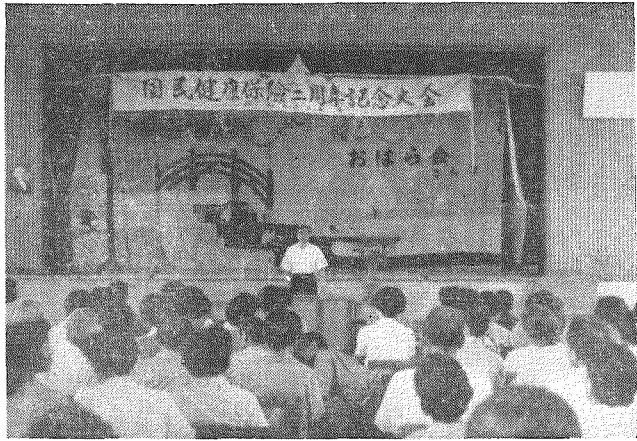
(国民健康保険感謝大会風景)