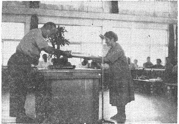
(2年間元気で記念品を受ける主婦)

ばいことです、国民健康保険も至町実施以来二年目を迎えましたの町としましては次の日程で二周年記念感謝大会並びに健康家庭表彰式を催しました。 なお健康家庭は二ヶ年継続健康家庭が一六八世帯、一ヶ年が二二四世帯となっています。 感謝大会は 九月十四日 山田小学校(山田校区) 十六日 帖佐小学校(帖佐校区)