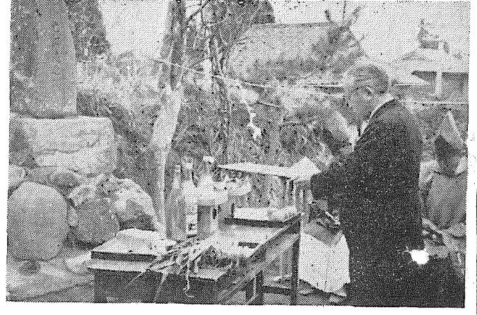
成美小学校八十八周年記念式典

成美小は2月28日創立88周年記念式典が盛大に行なわれました。明治9年5月28日宮脇小学校としてから発足し今年5月28日で満88周年になります。記念式典は、PTAを始め各種団体役員との関係等で日時を早めたものです。 成美小学校は創立以来、名称の変更、就学区域の変更など幾多の迂余曲折はありましたが、輝かしい伝統の中に順調な発展の道をたどってきました。人生にたとえるならば、まさに米寿の歳を迎えるわけです。今回の式典は今後も卒業生は一人一人、共に学んだ友を偲び、師を思い、懐しい校舎をまぶたに描いてお互の親睦を深め、なお一層母校の発展を祈念する意味で卒業生やPTAの役員が計画したものです。