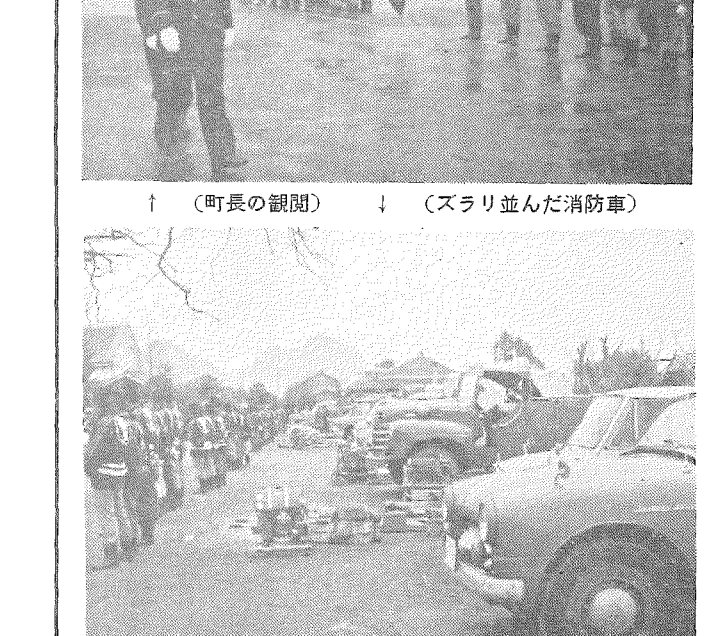
↑(町長の観閲) ↓(スラリ並んだ消防車)

恒例の出ぞめ式は、一月十二日午前十時から建昌小学校で、来賓をはじめ、児童、児童等多数の前で開かれた。 早朝から降る雨に關係者はうらめしう空を