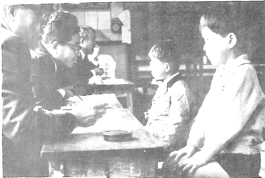
新入学児のテスト風景 (重富小学校にて)