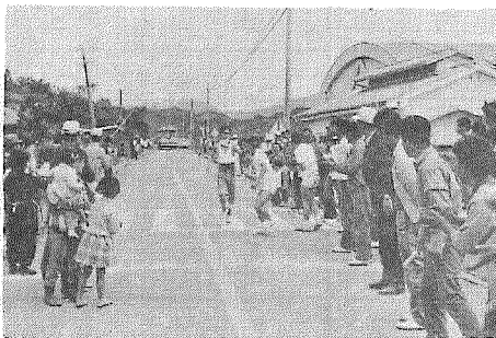
校区民の声援に選手 たちも一つしよけんめい