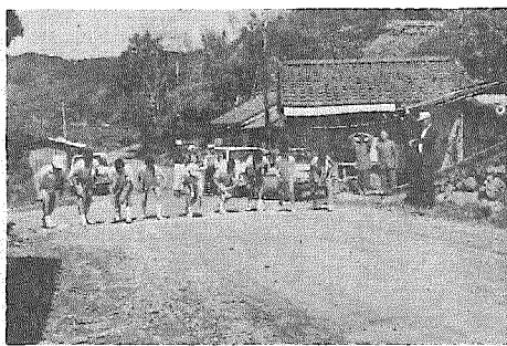
スタートラインに せいぞろいした選手たち

二十キロのコースで熱戦をくりひろげました。沿道には、校区民が総出で各選手にさかんな声援を送り大会を盛りあげ、予想以上の成果をあげました。大会後、振興会の関係者は毎年この大会を続け、過疎化を心配している校区民の意気の高揚と親和そして体育の向上に役立てると話されました。