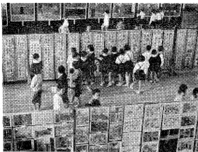
納税標語審査結果