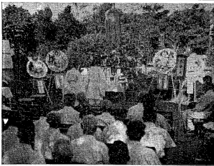
写真説明 …8月11日おこなわれた追悼碑除幕式

昭和二十年四月二十六日の才一 回空襲で十七人の死者を出し、同 年八月十一日の才二回空襲で二十 八人がなくなられ、合計四十五人 もの犠牲者を町内からだしたので あります。