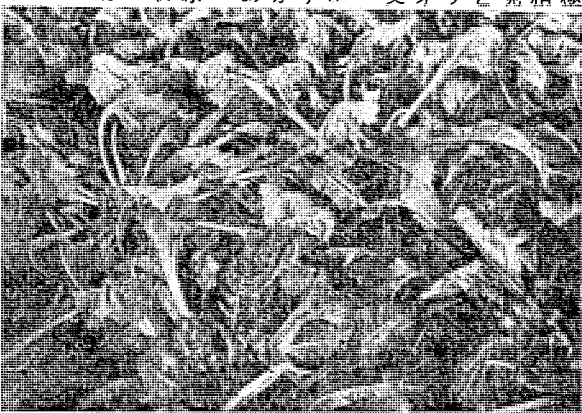
収かくをまつビート(同じく市来原台地で)