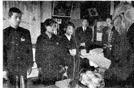
町長室で賞状や記念品を受けるよい子たち