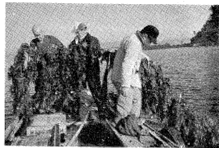
縄にいっぱいついたワカメ