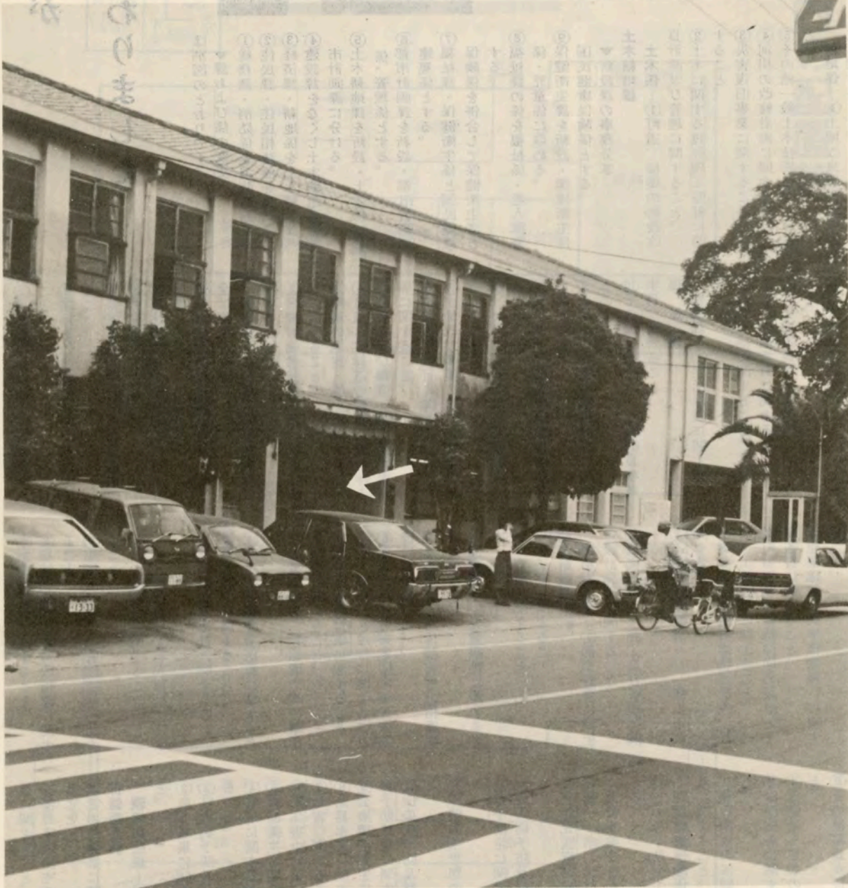
11月1日から役場の機構改革により正面玄関が 庁舎の中央に変わりました。(矢印し)